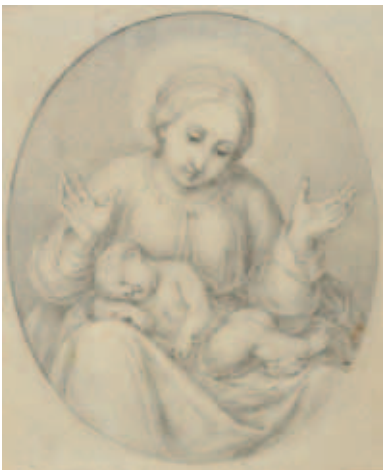
DANIEL FRÖSCHL Panna Maria s dětátkem, (po 1604) stříbrná tužka (olůvko), papír