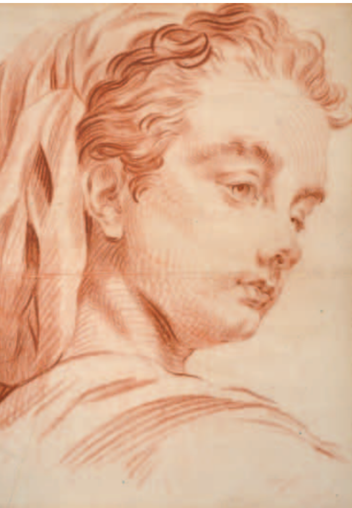
ALBERTUS CLOUET Portrét dívky v šátku, (po 1664 ?), rudka, papír