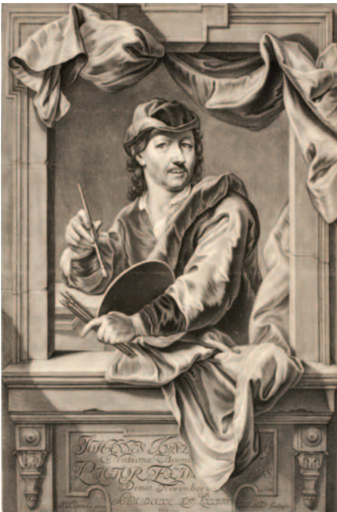
JOHANN JACOB HAID podle JANA KUPECKÉHO Portrét Jana Kupeckého, 1740, mezzotinta, papír