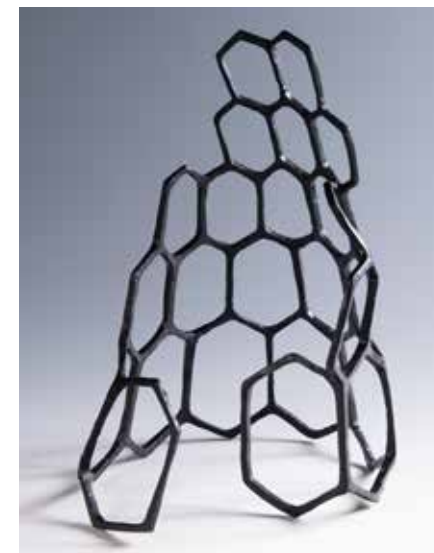
Struktura II 2019 sádra 35 × 35 × 40 cm