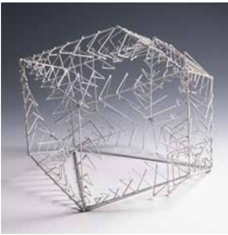
Schránka VII 2019 špejle 35 × 35 × 35 cm