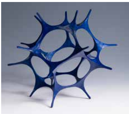
Struktura I 2019 sádra 35 × 35 × 40 cm