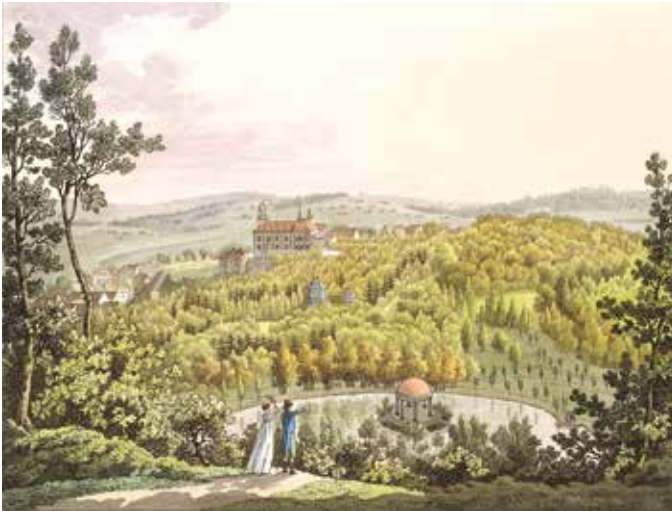
VÁCLAV ALOIS BERGER podle ANTONÍNA PUCHERNY Pohled do parku ve Vlašimi 1802 kolorovaný lept, papír