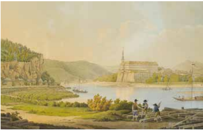
ERNST WEICHERT Zámek v Děčíně 1865 akvarel, papír